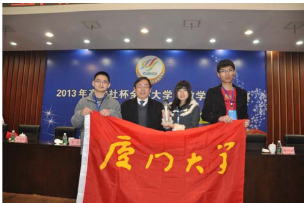
2013 年第二次获全国大学数学建模竞赛最高奖——高教社杯奖