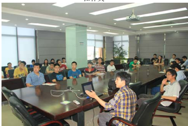
学生在全国拔尖学生交流会上做学术报告