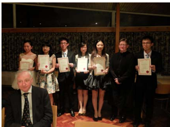
英国剑桥大学交流