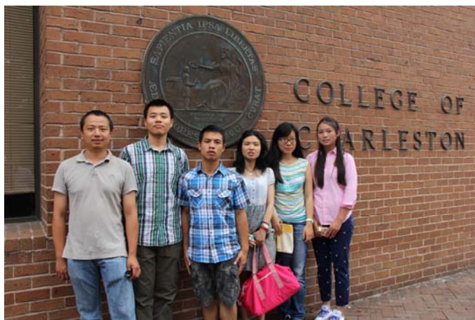
美国查尔斯顿学院交流

数学拔尖计划目前有60名学生入选，其中二、三、四年级配有专业导师。入选拔尖计划的学生绝大多数都可获得拔尖计划专项奖学金。除了日常的学习，学院还提供经费，组织了多项