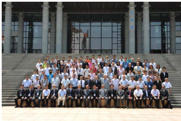
中法计算与应用数学研讨会（中法建交 50 周年庆祝活动之一）