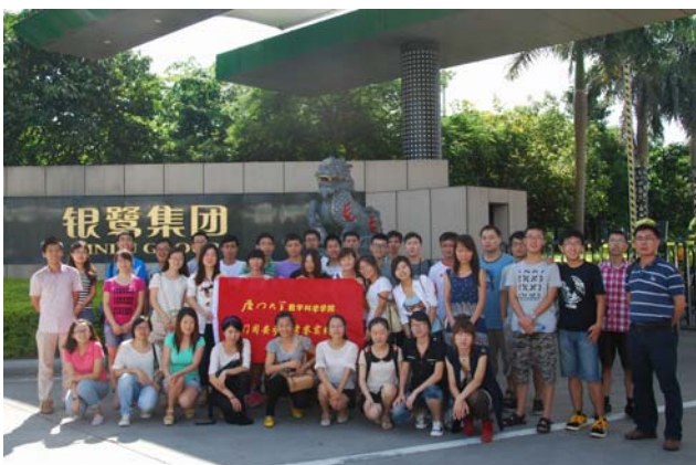
学生暑期社会实践活动