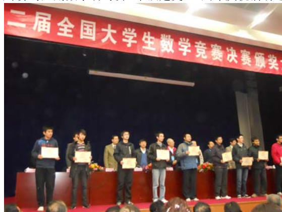
全国大学生数学竞赛一等奖（第二、四、五届）