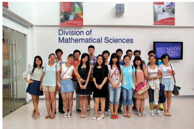
新加坡南洋理工大学交流

数学拔尖计划目前有60名学生入选，其中二、三、四年级配有专业导师。入选拔尖计划的学生绝大多数都可获得拔尖计划专项奖学金。除了日常的学习，学院还提供经费，组织了多项